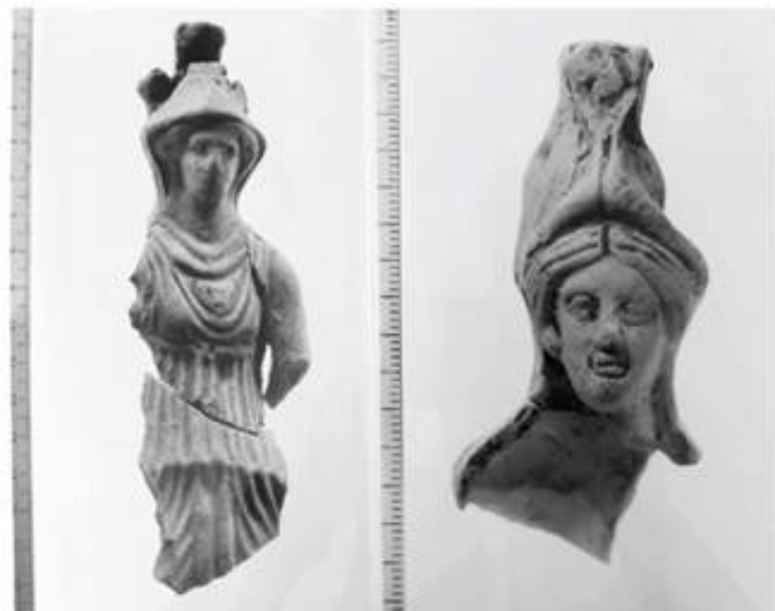
Terracotas de la diosa Minerva

El trabajo ha servido para que, a través de publicaciones científicas y de divulgación a todos los públicos, hoy en día se conozca el importante e interesante patrimonio histórico con el que cuenta la localidad, y por tanto se valore por parte de la población, sintiéndolo como algo suyo, sirviendo para que a la larga se proteja y se conserve para las generaciones venideras.