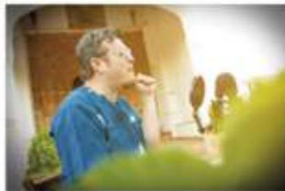
Grabación Duende Josele. Autor: Samuel Suárez. Fotografía